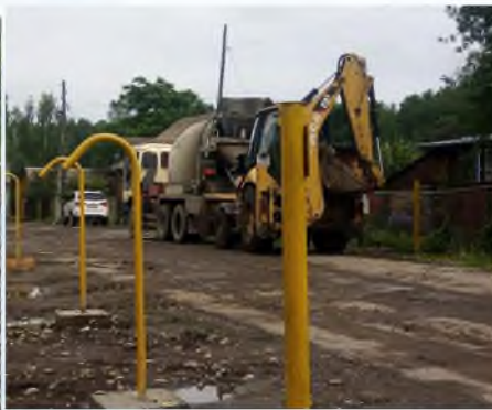
Строительство газовых котельных и сетей газоснабжения