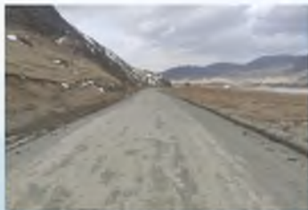
Ремонт дороги Черга-Беш-Озёк-Усть-Кан-Талда-Карагай-граница Казахстана с подъездом Талда -Тюнгур (Природный парк "Белуха«)

Горно-Алтайская агломерация – 10,96 км; дороги регионального значения – 245,5 км.