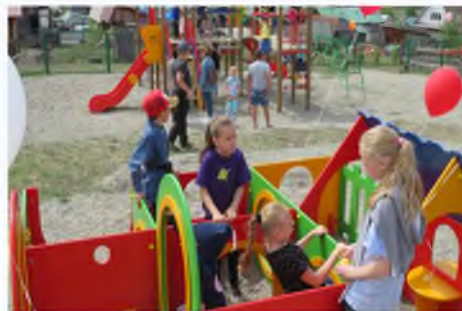
Благоустройство детской спортивной площадки в с. Усть-Кокса