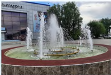
Благоустройство площади «Юбилейная» в с. Майма

В 1 квартале начаты работы на 3 общественных территориях.