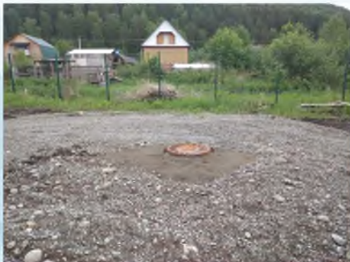
Строительство водопровода в с. Союзга Майминского района

В 2022 году продолжается строительство 4-х объектов газоснабжения в с. Майма. Начато проектирование 3-х объектов сетей газоснабжения в с. Манжерок, с. Озерное и с. Майма.