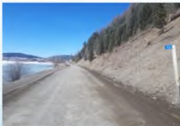
Ремонт дороги Акташ –Улаган-Балыктуюль